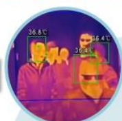
検温管理システム