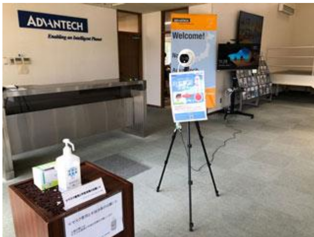
(参考) アドバンテックテクノロジーズ社内での運用試験の様子(福岡県直方市)

写真参考：アドバンテックテクノロジーズ社内(福岡県直方市)で先行実施されている、COVID-19 感染抑制ソリューションの運用実証試験