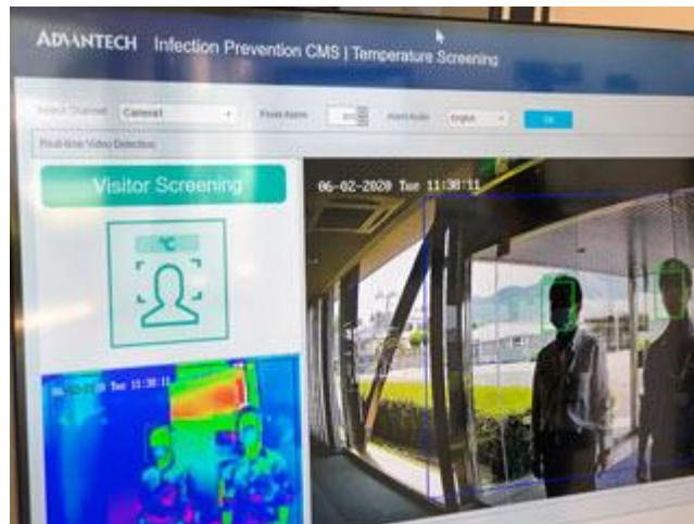
(参考) 感染抑制ソフトウェア(CMS)を活用し、逆光など様々な条件下での運用課題を検証